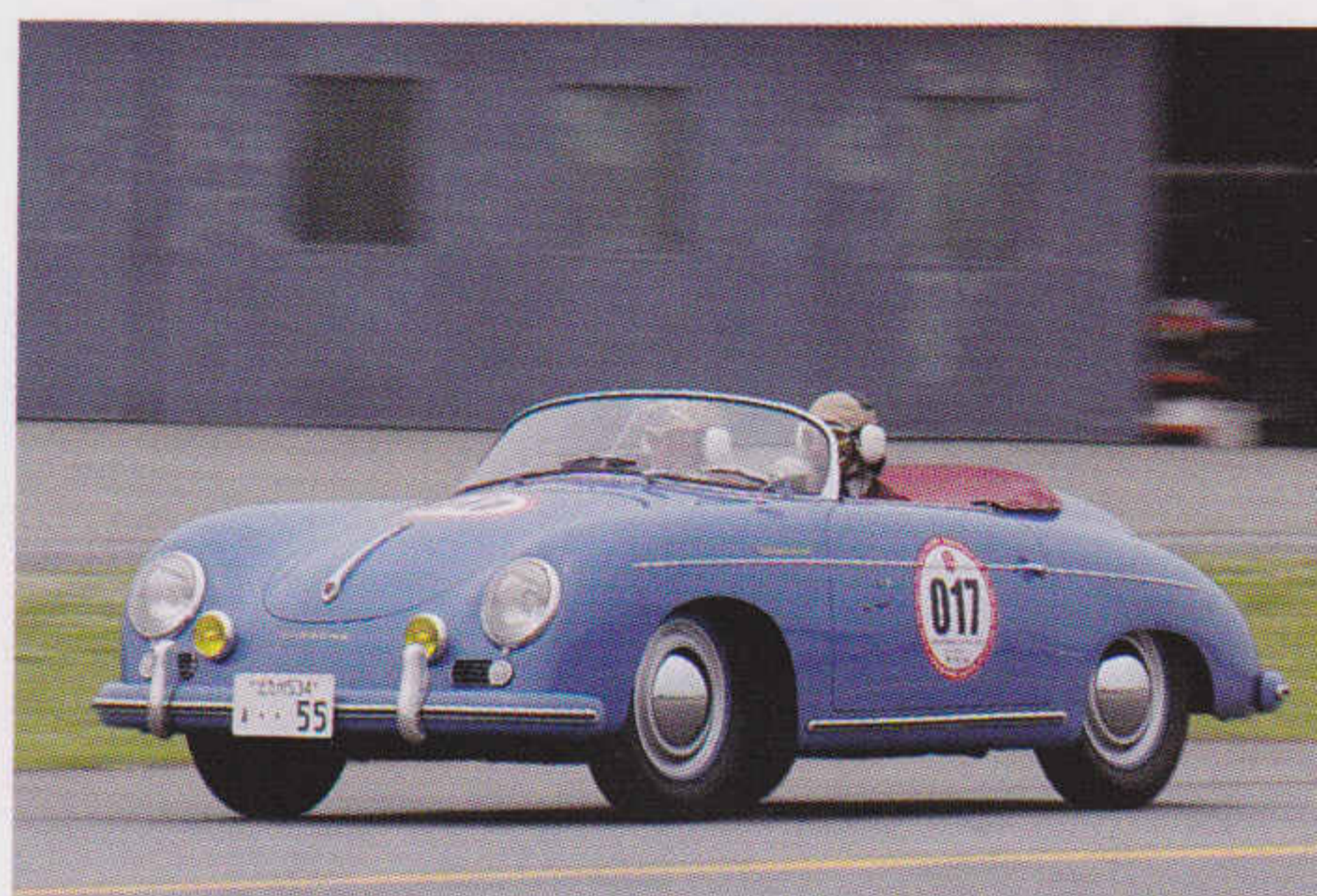
1955年式ポルシェ 356 プリア スピードスターを駆るRYUKEN氏は"ジャパン・ヒストリックカー・ツアー"の全ラウンド(北海道/神戸ステージを含む全10戦)に参戦しており、今回、皆勤賞を受賞した。

往年の名車やスーパーカーが各地を元気に走り回る姿を見て、子どもたちが夢を抱き、日本の未来が少しでも明るくなってくれれば幸いだ。